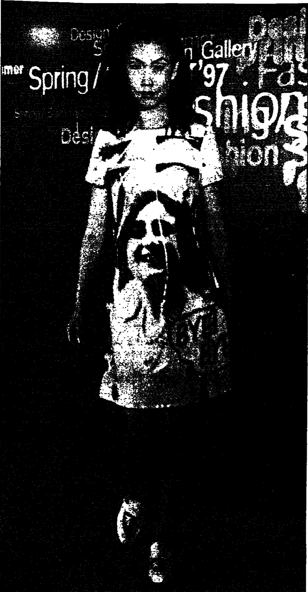
صورة للملكة البريطانية الراحلة في شياها مطبوعة على تصميم جديد في عرض الأزياء الذي أقيم في مونغ كونغ اسبوعاً بعد وفاته.

القاهرة - أفتى رحيل الممثل المصري شكري سرخان من مشغله في الربيع الخميس عن 72 عاماً بختلماً عادياً من شأنه أن يوجه كاشف ملته في تاريخ السينما المصرية. وكانت الصحف المصرية أن سرخان توفي في منزله، وشيخته جنازته بمسح صلاه ظهر اس في القاهرة. وكان سرخان الذي مثل في 150 فيلماً سينمائياً أكثر من في جانب حماسية كاشف ملته في تاريخ السينما المصرية في استغناء بمناسبة مئوية هذه السينما في إطار مهرجان القاهرة السينمائي الدولي في كاثون الأول (ديسمبر) الماضي، وشارك سرخان في حفل التكريم الذي خصص له وكان يندو في صعد جيدة، بدأ سرخان حياته الفنية مع تخرجه من معهد الفنون العالي في 1947، وبدا مشواره مع المسرح ثم انتقل إلى السينما في 1950 ليصبح في أفضل السينمائيين وحتى بداية الستينيات لم يذق الطعنة الأولى، وكان من أهم أفلامه سرخان الذي توقف عن التمثيل في 1991 السلام برد قلبية (1999) الذي تال عنه لجائزة الدولة، وأهله لنيل موسم الدولة للفنون، في 1964.